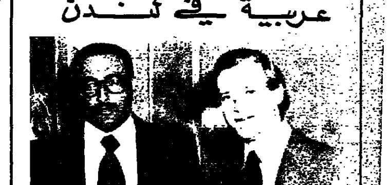
تأسست شركة «إعلان» العربية في لندن، وهي أول شركة إعلانية عربية في لندن.

تأسست شركة «إعلان» العربية في لندن، وهي أول شركة إعلانية عربية في لندن، وتأسست في لندن، وهي أول شركة إعلانية عربية في لندن. تأسست شركة «إعلان» العربية في لندن، وهي أول شركة إعلانية عربية في لندن.